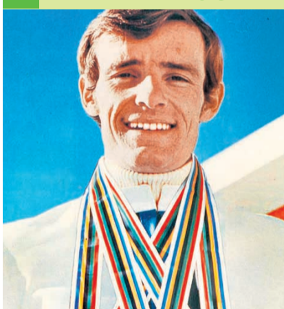
Jean-Claude Killy, *1943 französischer Skisportler, 3x olympisches Gold, mehrfacher Weltmeister

«Um zu gewinnen, muss man die Niederlage riskieren»